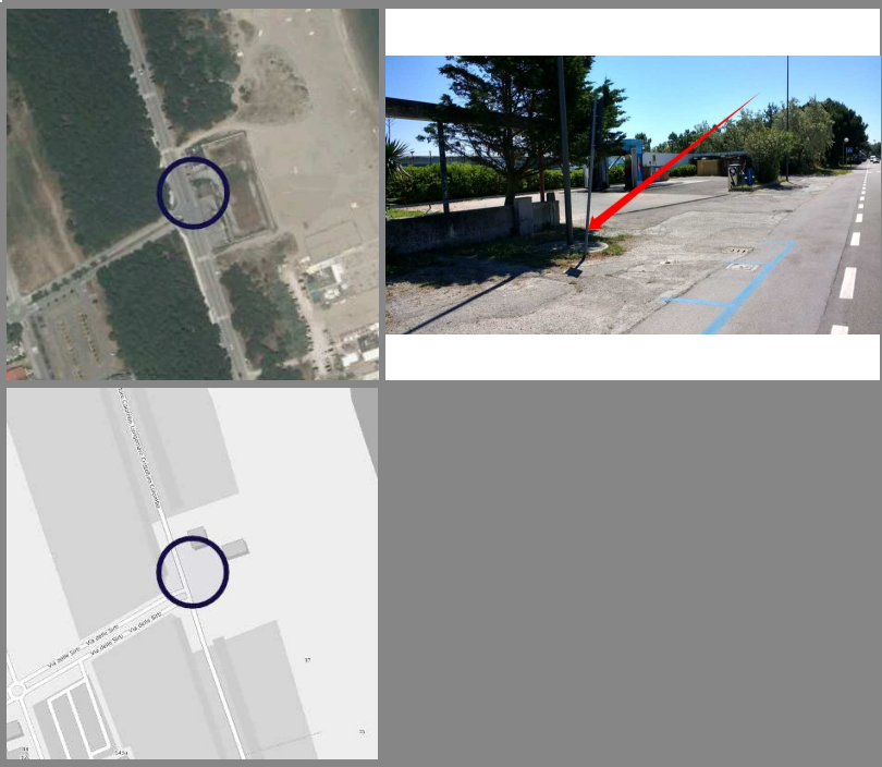
Volo aereo AGEA 2011

Comune di Ravenna - Rete di monitoraggio della subsidenza